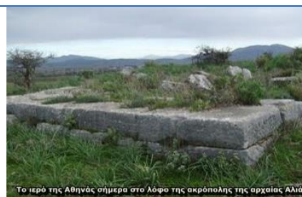
Το ιερό της Αθηνάς σήμερα στο λόφο της ακρόπολης της αρχαίας Αλιφί