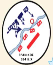
ΓΡΑΝΙΚΟΣ 334 π.Χ.