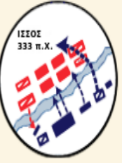
ΙΣΣΟΣ 333 π.Χ.