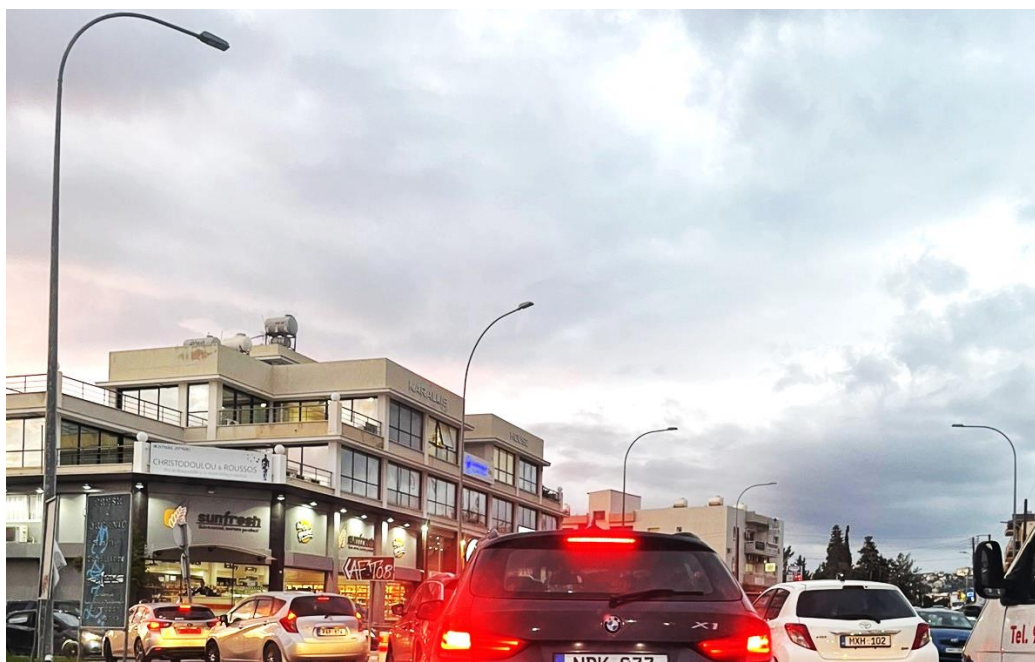
Εικόνα 1. Το κυκλοφοριακό «έμφραγμα» σε πλήρη εξέλιξη μετά τον κυκλικό κόμβο Αγίας Φύλας.

Στο πλαίσιο του προγράμματος "Νέοι Δημοσιογράφοι για το Περιβάλλον", πραγματοποιήθηκε σφυγμομέτρηση σε δείγμα 100 πολιτών και καταγράφηκε μια πραγματικότητα που κλονίζει τις προσδοκίες μας για ένα βιώσιμο αστικό κέντρο. Τα ευρήματα δεν είναι απλώς απογοητευτικά, αλλά σκιαγραφούν μια πορεία για την πόλη της Λεμεσού που επιβάλλει την άμεση αναθεώρηση του μοντέλου ανάπτυξής της.