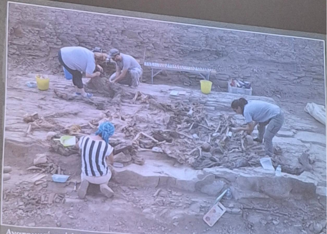
Ανατομική ταφή: Όταν μια ταφή δεν έχει διαταραχθεί και εντοπίζονται ένας ή και περισσότεροι ολοκληρωμένοι σκελετοί.