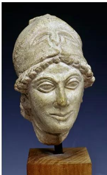
Κεφαλή της θεάς Αθηνάς από ασβεστόλιθο. Από το ιερό της Αθηνάς στο Βουνί. Κυπριακό Μουσείο, Λευκωσία.

Στο πιο ψηλό σημείο του λόφου, νότια του ανακτόρου, βρισκόταν το ιερό της Αθηνάς. Το ανάκτορο και το ιερό καταστράφηκαν στις αρχές του 4ου αι. π.Χ.