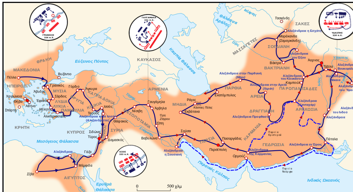
2) Χάρτης της Εκστρατείας του Αλεξάνδρου: οι μάχες και οι ιδρυθείσες ή εξελληνισμένες πόλεις

Hermann Bengtson, Ιστορία της Αρχαίας Ελλάδος , εκδόσεις ΜΕΛΙΣΣΑ, Αθήνα 1991 2 , σελ.316