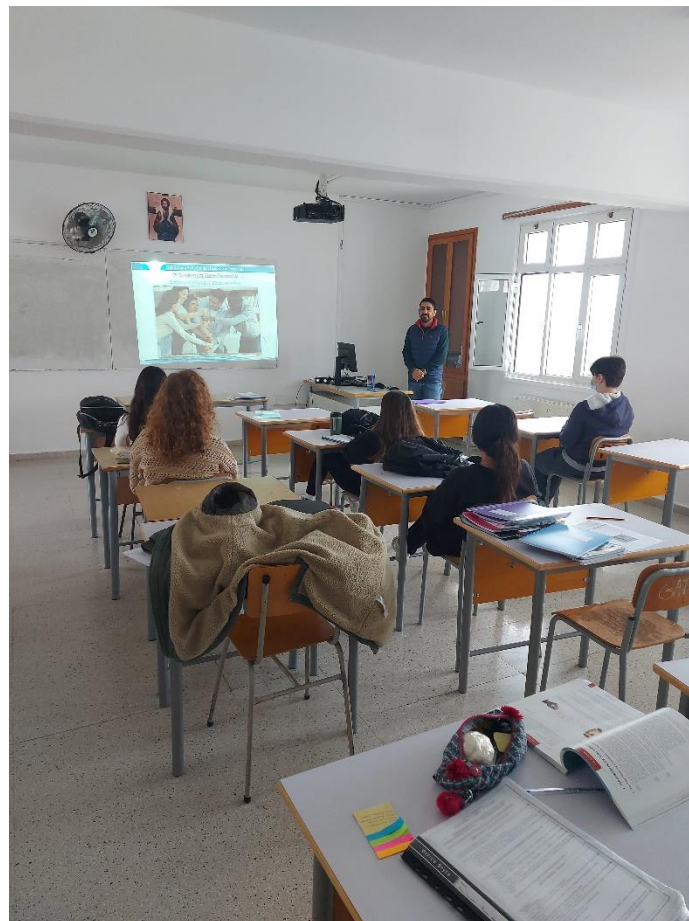
4. Ενεργοί Πολίτες για το Περιβάλλον: Η συμμετοχή εκπαιδευτικών και μαθητών στην εκστρατεία Ανακύκλωσης απορριμμάτων στο Λύκειο Αγίας Φυλάξεως, μέσα από ένα παιχνίδι. (Μάρτιος, 2022. Δρ Δήμητρα Χατζηχαμπή)